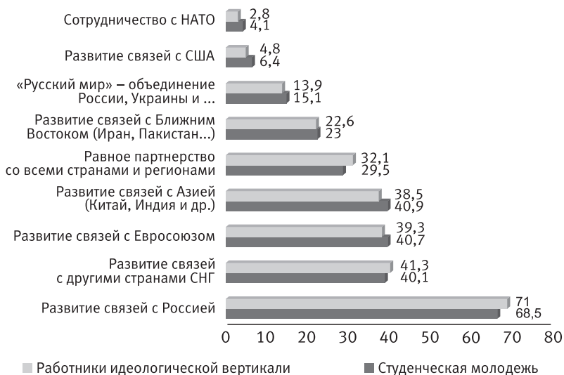
Рисунок 2 – Основные перспективные направления внешней политики Республики Беларусь (сравнение по группам, %)

ми, по мнению респондентов, расширению связей Республики Беларусь с США, ЕС и НАТО, являются «внешнеполитическая и экономическая зависимость от России» и «искусственная внешнеполитическая изоляция Республики Беларусь». «Осознание своей независимости и самобытности» граничит с «экономической и финансовой нецелесообразностью», учитываются также и личные предпочтения руководства страны ( Рисунок 2 ).