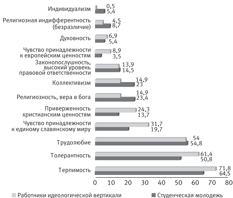
Рисунок 1 – Основные отличительные черты белорусского менталитета (сравнение по группам, %)

ет сильное сознание непрерывности и преемственности русской государственной и общественной традиции, начиная со времени Киевской Руси и заканчивая нынешней Россией, Украиной, Беларуссией» [136].